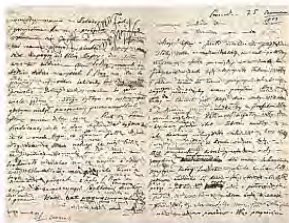
List do Ludwika

Z wiedeńskiego sukcesu brata w roku 1829 cieszyliśmy się w domu jak dzieci. Frycek pisał do nas po koncertach: Pierwszym razem wszyscy dobrze mnie przyjęli, wczoraj było jeszcze lepiej. Wiem, że podobałem się damom i artystom. Pewien baron powiedział, że za szybko opuszczam Wiedeń i powinienem tu wrócić. Odpowiedziałem, że przyjadę się uczyć. Baron stwierdził, że w takim razie nie mam po co przyjeżdżać. Nikt mnie tu za ucznia brać nie chce. Niczemu się tu tak nie dziwię, jak temu, że ja się w Warszawie wszystkiego nauczyłem. Z panami Żywnym i Elsnerem największy osioł by się nauczył.